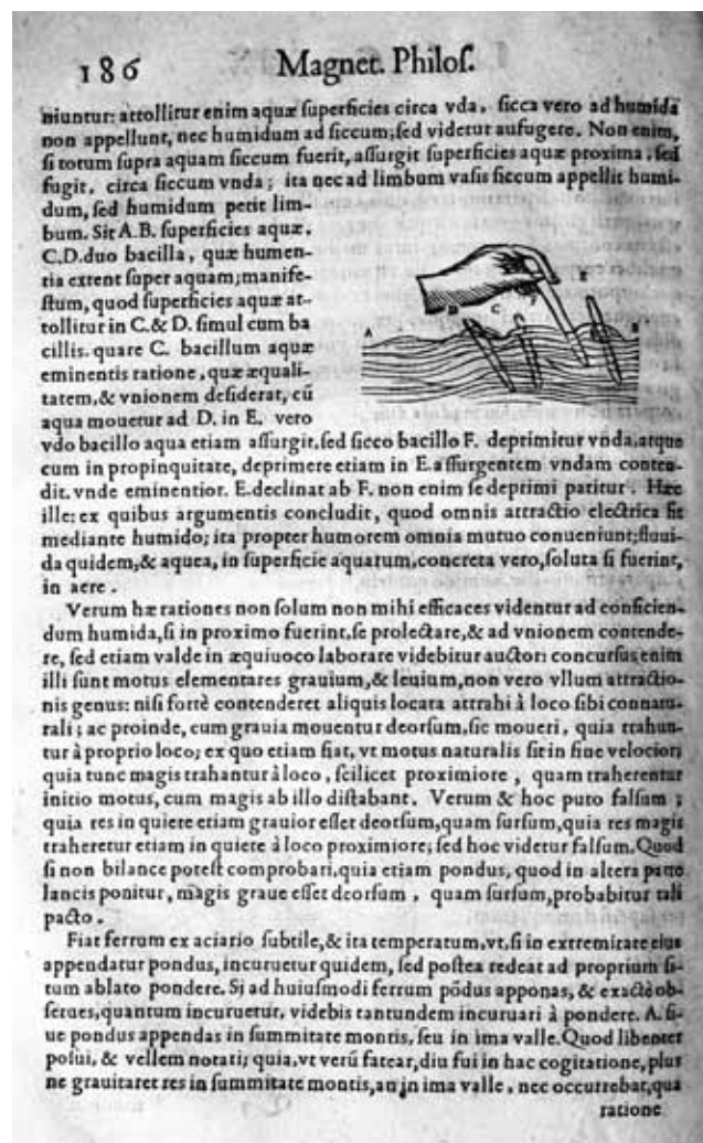
Slika 3: Cabeovo preizkušanje delovanja magnetu pod vodo v Valvasorjevo zbirki (Cabeo, 1629, str. 186).

Valvasor je ob najpopolnejši kranjski zbirki Kircherjevih del kupil še dvanajst Schottovih matematično-tehničnih priročnikov, saj je bil Schott najpomembnejši Kircherjev učenec. K nabavam njegovih spisov je Valvasorja napeljal zanimanje za izum vakuumske črpalke, ki jo je prav Schott prvi opisal in narisal. Valvasor je Schottova dela in devet Kircherjevih knjig citiral v Slavi, saj je bil prav Kircher pisec, ki ga je uporabljal največ. Valvasorjev vzornik Volf Turjaški je imel osem Schottovih del, seveda prav tako kot Valvasor vse tiste, povezane z vakuumskimi tehnikami. Volfov brat knez Janez Vajkard je bil pglavitni Guerickejev sodelavec pri vakuumskih poskusih v Regensburgu, tesno pa je sodeloval tudi s Kircherjem. Ohranilo se je šest