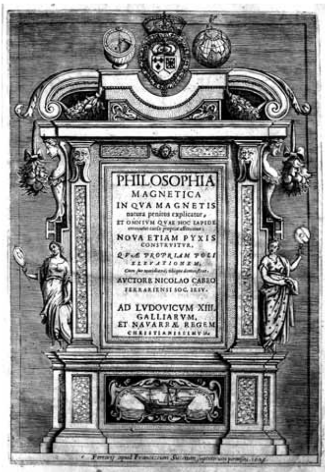
Slika 2: Naslovna stran Cabeove knjige o magnetih (1629), ki jo je hranil Valvasor (Fotografirano v zbirki za zgodovino znanosti z dovoljenjem univerze v Oklahomi).

Pozneje je Cabeo skupaj s svojimi ferrarskimi someščani nasprotoval hidravličnim idejam Galilejevega učenca Benedetta Castellija pri urejanju reke Reno, ki jih je podpiral papež Urban VIII. Vakuuma ni priznaval, saj naj bi motil lokalno gibanje. 29