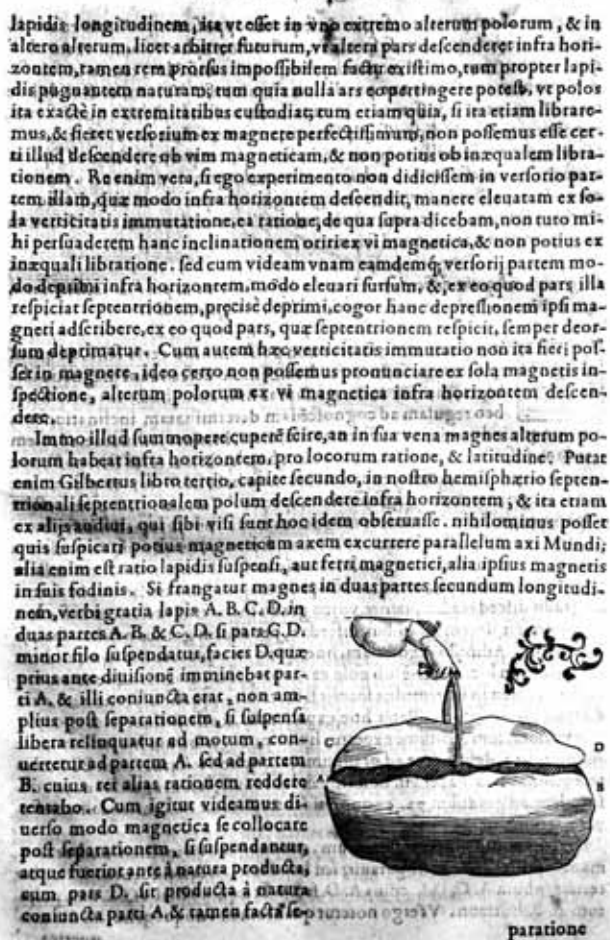
Slika 4: Cabeovi poskusi z lomljenjem magnetu v Valvasorjevi zbirki (Cabeo, 1629, str. 81). (Fotografirano v zbirki za zgodovino znanosti z dovoljenjem univerze v Oklahomi.)

Janezovih pisem Kircherju v Rim; 32 seveda mu je pisal latinsko, saj Kircher po naše ne bi razumel. Drugo pismo je poslal tik preden sta z Guerickejem izpeljala sloviti poskus s konji in vakuumskima polkroglama v Regensburgu, zadnje pa je napisal v Ljubljani malo preden se je Valvasor naselil na Bogenšpergu. Kircherjeva in druga temeljna znanstvena raziskovanja so bila očitno bližje baročni Ljubljani, kot so danes.