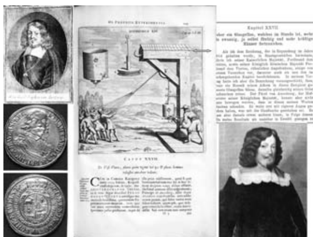
Slika 2: Predlog novega simbola društva