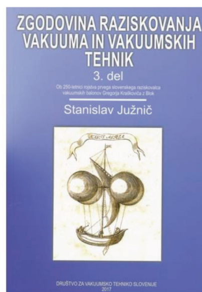
Slika 3: Pomembna aktivnost našega društva je izdajanje tehniške in znanstvene literature v slovenskem jeziku.