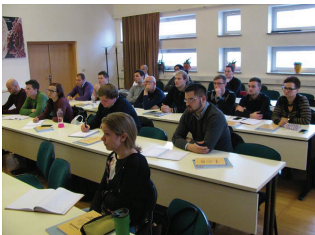
Slika 2: Društvo DVTS organizira zelo popularne dvodnevne tečaje vakuumske tehnike, ki se ga udeleži od 20 do 30 udeležencev. Fotografija prikazuje udeležence tečaja v letu 2015.