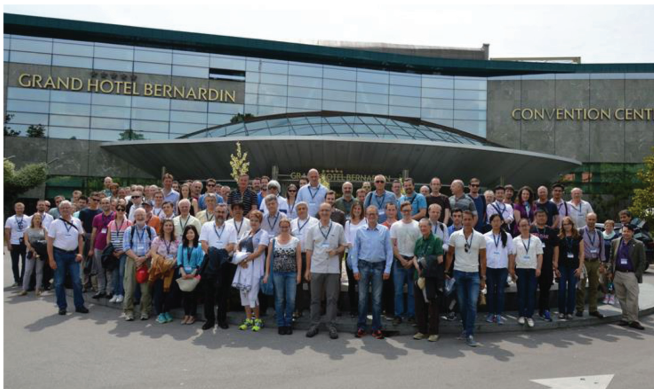
Slika 1: Največji organizacijski dogodek našega društva v zadnjem desetletju je bila organizacija 14. Evropskega vakuumskega kongresa skupaj s 16. Združeno vakuumsko konferenco v juniju 2016 v Portorožu, ki se ga je udeležilo 170 udeležencev.

Delovanje društva je na več področjih. Ena od pomembnejših aktivnosti društva je izdajanje strokovne literature, predvsem na področju vakuumskih tehnologij v slovenskem jeziku. Naše glasilo Vakuumist izhaja od leta 1981 in je do sedaj izšlo 39 letnikov pod